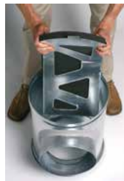
Installation du déflecteur acoustique et aéralique dans le caisson piquage