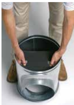
Installation du déflecteur acoustique et aéralique dans le caisson piquage