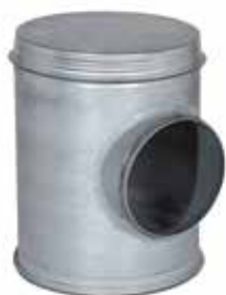
Caisson Piquage à joints

Le CP à joints assure la jonction et l'accessibilité du réseau collecteur vertical et du réseau horizontal tout en assurant une étanchéité classe C.