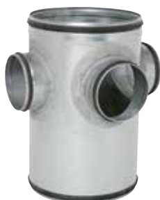
Collecteur Raccord d'Étage à joints

Le CRE à joints permet de raccorder 1 à 3 piquages en diamètre 125 sur la colonne verticale tout en assurant une étanchéité classe C.