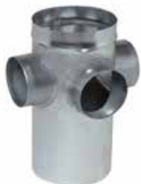
Collecteur Raccord d'Etage standard

Le CRE standard permet de raccorder 1 à 4 piquages sur la colonne verticale.