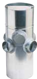
Collecteur Raccord d'Etage multilogement

Le CRE multi-logement permet de raccorder deux logements d'un même niveau sur une même colonne verticale.