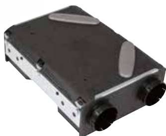
Echangeur statique collectif

Système double flux sans moteurs en habitat collectif