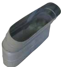
Coude Vertical Oblong 30°

Le coude vertical oblong 30° permet de changer la direction d'un réseau oblong de 30°.