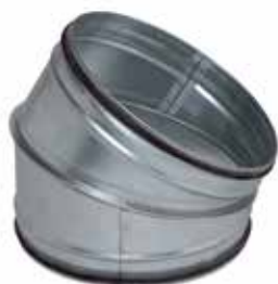
Coude 30° à joints

Le coude 30° à joints permet de changer la direction d'un réseau galvanisé de 30° tout en assurant une étanchéité classe C.