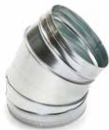
Coude 45° secteur

Le coude 45° permet de changer la direction d'un réseau galvanisé de 45°.