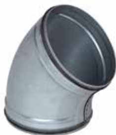
Coude 45° à joints

Le coude 45° à joints permet de changer la direction d'un réseau galvanisé de 45° tout en assurant une étanchéité classe C.