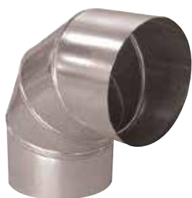
Coude 90° en aluminium

Le coude 90° alu permet de changer la direction d'un réseau aluminium de 90°.