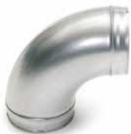
Coude 90° embouti

Le coude 90° permet de changer la direction d'un réseau galvanisé de 90°.