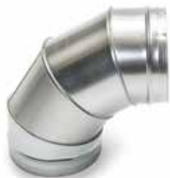
Coude 90° secteur

Le coude 90° permet de changer la direction d'un réseau galvanisé de 90°.