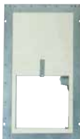
Volet GDF en position attente

Le volet GDF est un volet de transfert à guillotine E60 (1h) qui permet le transfert d'air entre un couloir et un sas en solution B des IGH.