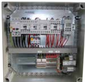
Coffret de désenfumage habitat collectif

Les coffrets de désenfumage parking habitat permettent de piloter les ventilateurs hélicoïdes 2 vitesses pour la ventilation et le désenfumage.