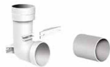
Contre-prise universelle (A + B)

Intégration discrète des prises d'aspiration