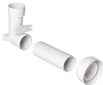
Contre Prise Celiane Filaire

Intégration discrète des prises d'aspiration