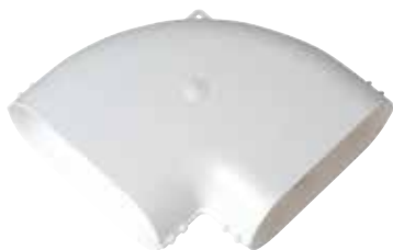
Coude horizontal 90°