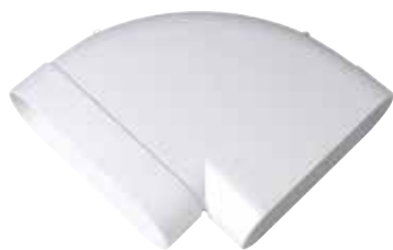
Coude horizontal 90°