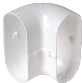
Coude vertical 90°