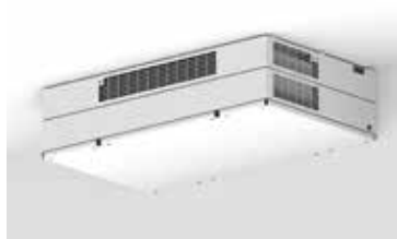
DEX3000 ST (apparente)

La solution de traitement d'air la plus aboutie pour les écoles, silencieuse et énergétiquement sobre.