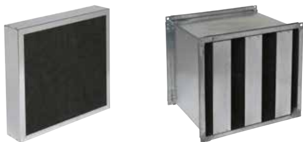
ECTA 100 L/H 1400-1999

Le piège à son rectangulaire ECTA atténue fortement la propagation acoustique (basses, moyennes et hautes fréquences) dans un réseau rectangulaire.