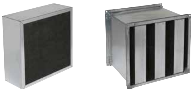
ECTA 100 L/H 2000-2400

Le piège à son rectangulaire ECTA 200 atténue fortement la propagation acoustique (basse, moyenne et haute fréquences) dans un réseau rectangulaire.