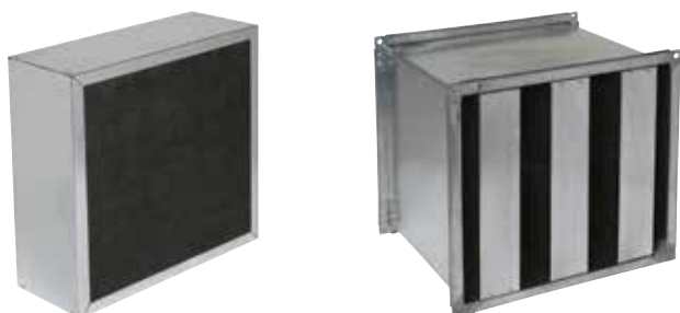
ECTA 200 L/H 2000-2400

Le piège à son rectangulaire ECTA 200 atténue fortement la propagation acoustique (basse, moyenne et haute fréquences) dans un réseau rectangulaire.