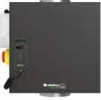
EasyVEC® Compact Micro-watt 3000

La gamme de caissons simple-flux la mieux pensée du marché afin de rendre la ventilation performante, sereine et facile.