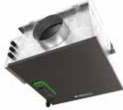
EasyVEC® Compact Micro-watt 3000