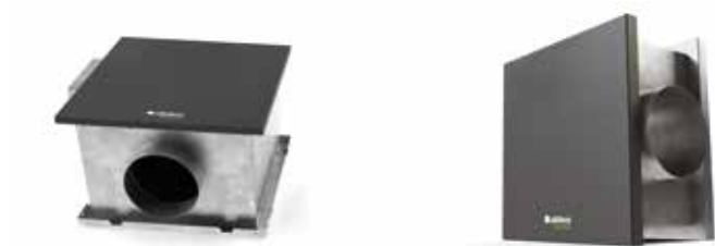
EasyVEC Compact 3000

La gamme de caissons simple-flux la mieux pensée du marché afin de rendre la ventilation performante, sereine et facile.