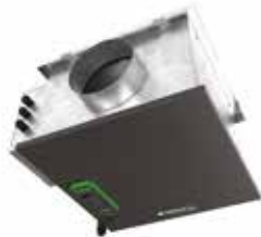
EasyVEC® Compact Micro-watt 3000