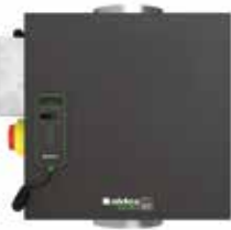
EasyVEC® Compact Micro-watt 3000

La gamme de caissons simple-flux la mieux pensée du marché afin de rendre la ventilation performante, sereine et facile.