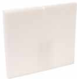
Mousse acoustique D100 mm