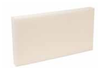
Mousse acoustique D125 mm