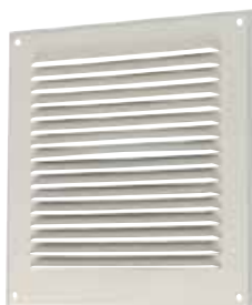
Grille métallique GAT

GAT-GR sont les grilles métalliques d'aération à destination des maisons individuelles et des logements collectifs.