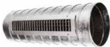
GD102 F1 525X125

La grille intérieure pour conduit GD 102 est destinée à la reprise d'air dans les locaux tertiaires.