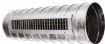
GD102 F1 625X75

La grille intérieure pour conduit GD 102 est destinée à la reprise d'air dans les locaux tertiaires.