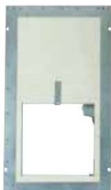
Volet GDF en position attente

Le volet GDF est un volet de transfert à guillotine E60 (1h) qui permet le transfert d'air entre un couloir et un sas en solution B des IGH.