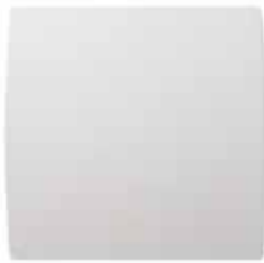
GRAPHIC vue de face