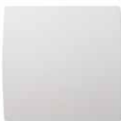
GRAPHIC vue de face