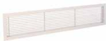
Grille Gridlined wall

La grille murale intérieure fixe en aluminium GRIDLINED Wall est destinée au soufflage et à la reprise de l'air dans les bâtiments tertiaires.