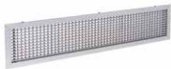
GRIDLINED WALL D

La grille murale intérieure fixe en aluminium GRIDLINED Wall est destinée au soufflage et à la reprise de l'air dans les bâtiments tertiaires.