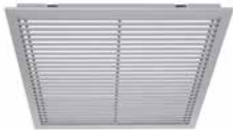
Grille gridlined exhaust

La grille intérieure fixe en aluminium GRIDLINED Exhaust est destinée à la reprise de l'air dans les bâtiments tertiaires.