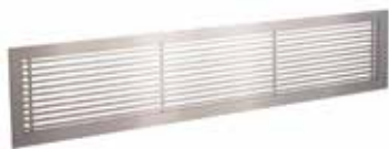
Grille Gridlined wall

La grille murale intérieure fixe en aluminium GRIDLINED Wall est destinée au soufflage et à la reprise de l'air dans les bâtiments tertiaires.