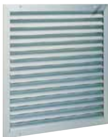
Grille AWA 251

La grille murale extérieure AWA 251 permet la prise d'air neuf ou au rejet d'air vicié des systèmes de ventilation.