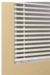
Grille GFE 007 Liseré installé avec cadre arrasant

Le cadre non apparent de la grille GFE 007 - Liseré offre une esthétique élégante et discrète tout en couvrant la réservation.