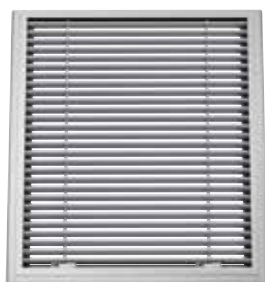
Grille GFAP 007

La grille esthétique GFAP 007 permet de cacher toute réservation ou tout volet de désenfumage.