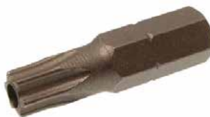
Embout pour visser les vis inviolables