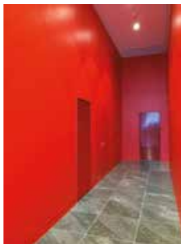
Grille GGH esthétique installée dans un couloir