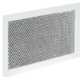
Grille SC 125

La grille murale perforée SC 125 assure la reprise d'air dans les installations de ventilation et de climatisation avec une esthétique discrète.