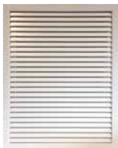
Grille de reprise T.One® AquaAIR/T.One® AIR