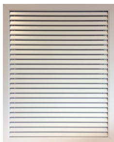
Grille de reprise T.One® AquaAIR/T.One® AIR