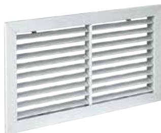
Grille SC 121

La grille murale SC 121 en acier permet la reprise d'air dans un local pour des installations de ventilation ou de conditionnement d'air.