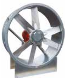
HELIONE 2 pôles Virole courte

HELIONE 2 pôles est une gamme de ventilateurs de désenfumage hélicoïdes F400-120 optimisé pour agir en ventilation et/ou en désenfumage dans des locaux d'habitat, dans des locaux tertiaires et dans des bâtiments industriels.