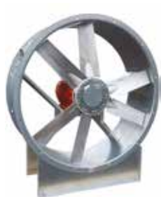
HELIONE 2 pôles Virole courte

HELIONE 2 pôles est une gamme de ventilateurs de désenfumage hélicoïdes F400-120 optimisé pour agir en ventilation et/ou en désenfumage dans des locaux d'habitat, dans des locaux tertiaires et dans des bâtiments industriels.