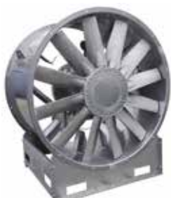
HELIONE 2 pôles Virole longue